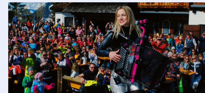
▲ Open Air Party beim Ski amadé Winterfest in Dorfgastein