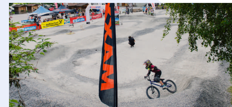
▲ Bikeerlebnis direkt am Großarler Bergbahnen Parkplatz, Pumptrack Großarltal

frequentierten Pumptrack auf dem Großarler Liftparkplatz geschaffen. Zusammenfassend gesehen geben wir unkompliziert und gerne. Wir bitten aber um Verständnis, dass wir nicht alle Wünsche erfüllen können.